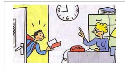
Contrôle de la présence et de la ponctualité des élèves