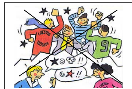
Sécurité des élèves