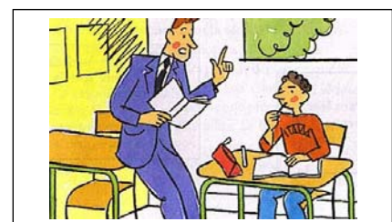
Aide aux élèves en difficulté