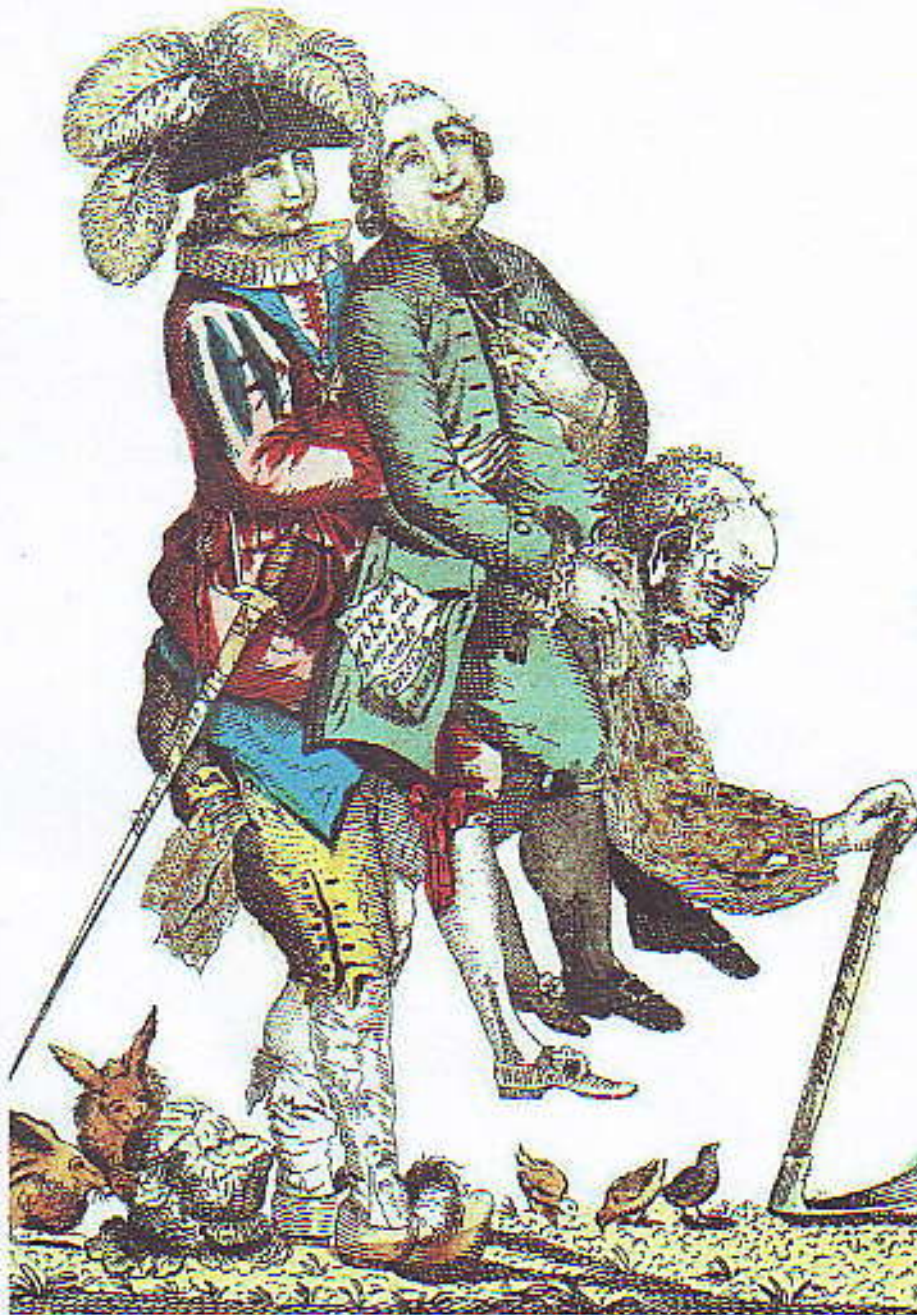
(Ce ne durera pas toujours, gravure du XVIIIème siècle, BNF, Paris)