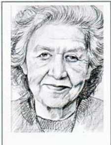
Collège Jacqueline de Romilly