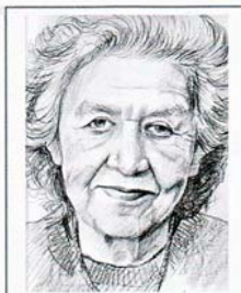
Collège Jacqueline de Romilly