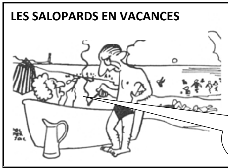
Dessin de Pol Ferjac paru dans Le Canard enchaîné , le 12 août 1936.